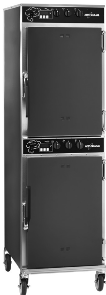
С дополнительной темно-красной внешней отделкой